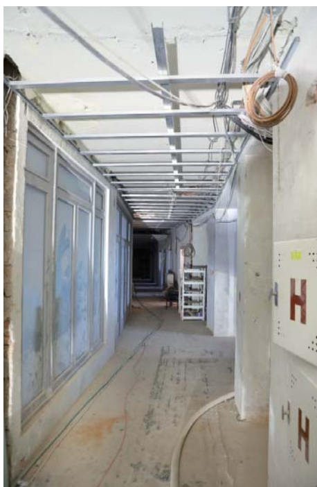
Montáž kovových profilů pro zabudování sádkartonových desek.