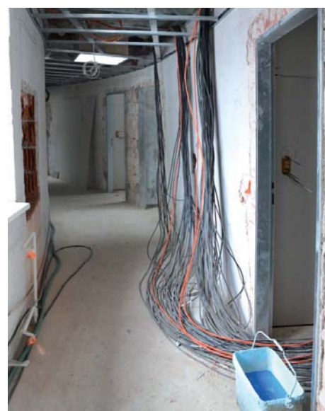
Chodba v „podkově“ – nové elektrické rozvody a zárubně dveří do pokojů.