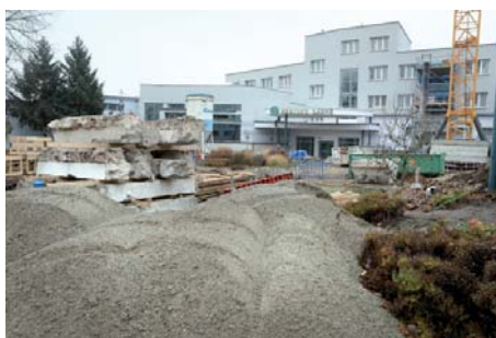
Zadní vchod dnes rozhodně nepřipomíná vstup do lázeňské budovy.