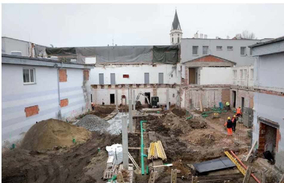
Dvůr v „podkově“, kde po rekonstrukci bude jídelna a část kuchyně.

Od září probíhají intenzivní práce na rekonstrukci Bertiných lázní, jejíž součástí je rozšíření a rekonstrukce kuchyně, novostavba jídelny (v prostoru bývalého dvora) a opravy 87 stávajících pokojů. Akce zasahuje i do přilehlých prostor, jako jsou chodby, schodiště, léčebné provozy, původní jídelny a zázemí restaurace Adéla. Jak to v Bertiných lázních vypadalo v době uzávěrky prosincového vydání Lázeňské pohody 20. listopadu, můžete vidět na snímcích Romana Růžičky.