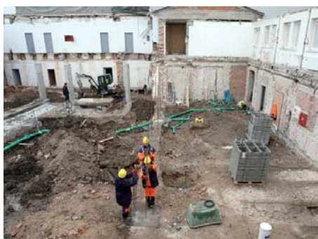
Pohled do dvora „podkovy“ – v pravé části je ubouraná část bývalé kuchyně, která se bude rozšiřovat.